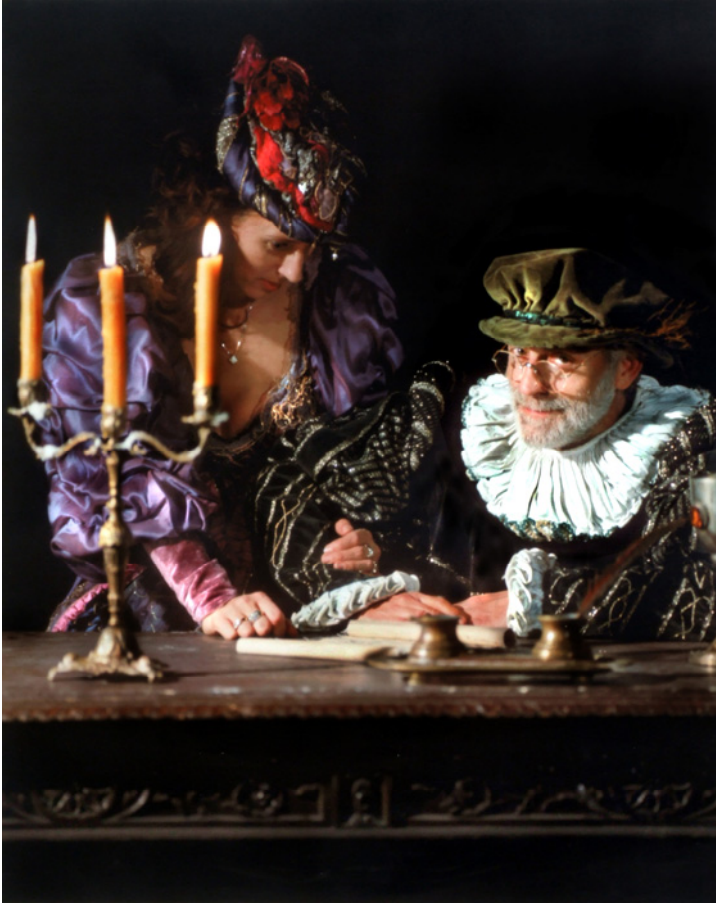
Слика 5: Навипов календар за 2002. годину, Београд 2001.