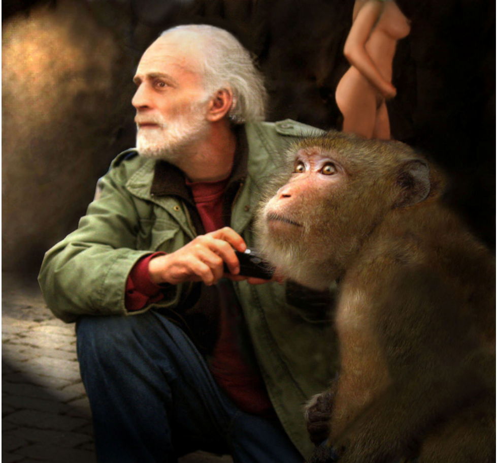
Слика 3: На једном од московских аеродрома приликом путовања за Монголију, 2006.