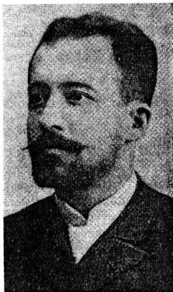
Фиг. 1. Професор Марин Бъчеваров.

Пристъпвам към изброяване на онези хора, които са имали пряко или косвено отношение към университетската астрономия.