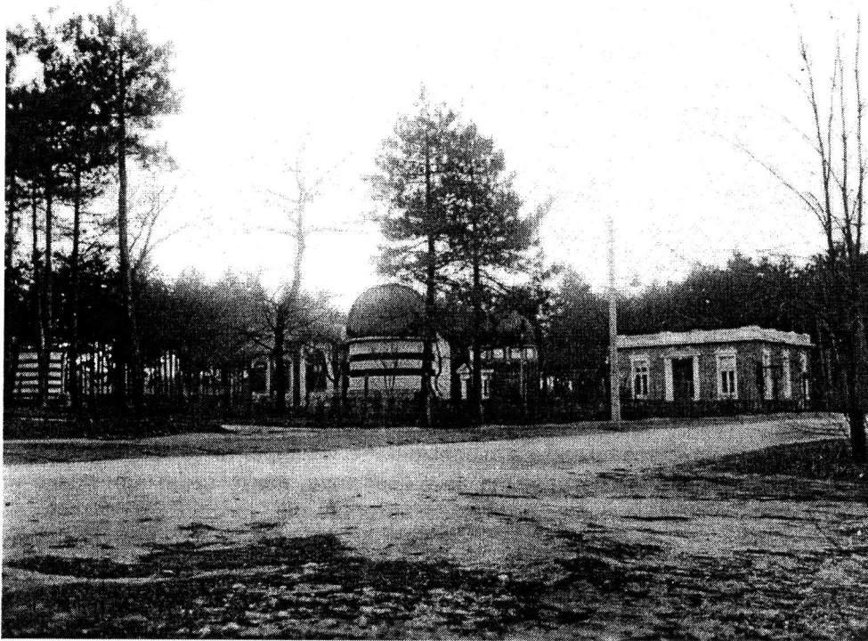
Фиг. 2. Старото здание на Астрономическата обсерватория на Софийския университет.

като извънреден преподавател (15.02.1892 г.), а от 1.09.1893 г. - като редовен професор. Той е получил образованието си в Русия. Като ученолюбив и природно надарен младеж получава стипендия за обучение в Русия от българското правителство. Завършил е реална гимназия в гр. Николаев и Физико-математическия факултет на Московския университет през 1884 г. също като стипендиант на българското правителство.